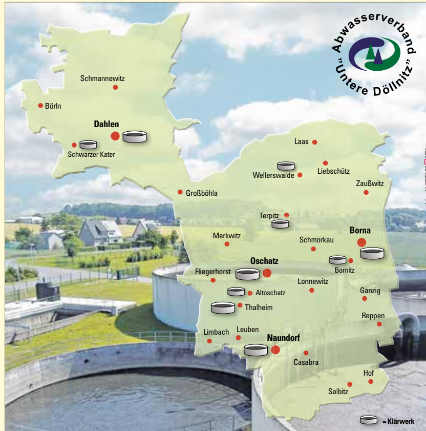
Das Verbandsgebiet des AV „Untere Döllnitz“ erstreckt sich über rund 232 km 2 . Ein Teil des Abwassers dieses Gebietes wird von der Kläranlage Oschatz (siehe Foto) gereinigt. Neun weitere Kläranlagen sind im Einsatz.