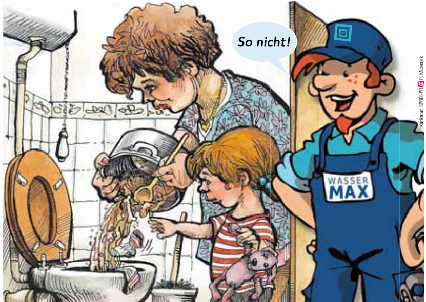
Essensreste haben in der Toilette nichts zu suchen. Sie enthalten viel Fett, verstopfen deshalb die Kanalisation und locken Ratten an.

Damit werden Kosten verursacht, die der Abwasserverband „Untere Döllnitz“ natürlich gern einsparen würde. Neben Ungeziefer sind Inhaltsstoffe im Abwasser, wie z.B. Braten- oder Frittierfett, verantwortlich für Schäden am Kanalnetz. Das Rohmaterial