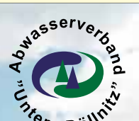
Infografik SPEER-PR © 2009

me, die 1995 bilanziert wurde. In diesem Zeitraum hat der Verband z. B. je ein Regenüberlaufbecken am Busbahnhof in Dahlen und am Stadthaus in Oschatz errichtet sowie Borna und Naundorf abwassertechnisch erschlossen. Allein 2008 wurden im Sinne der Kunden rund 5 Mio. Euro in die Abwasserentsorgung investiert. Und auch für das kommende Jahr sind wichtige Projekte geplant. Die Verbandsverwaltung hat vorgeschlagen, letzte Arbeiten an der neuen Kläranlage in Dahlen zu beenden und mit dem ersten Abschnitt zur Erschließung der Ortslage Mannschatz zu beginnen. In Wellerswalde soll die überdimensionierte und verschlissene vollbiologische Kleinkläranlage durch eine neue Anlage ersetzt werden.